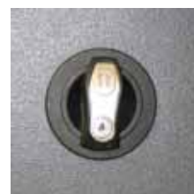
Cilinderslot in handvat