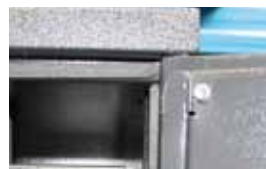
Speciale rubberen dichtingen